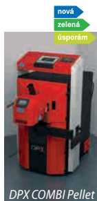
DPX COMBI Pellet